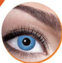
Студрове напилення брів