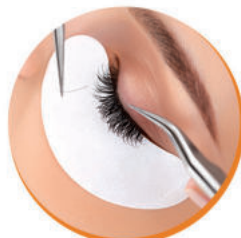
Нарощування та ламінування вій